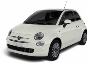
FIAT 500 1.0 Hybrid Lounge